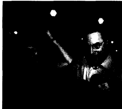
左:《禅宗少林·音乐大典》带给人前所未有的视听体验