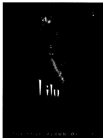
片名：花雨巧集 片号：雨林 H-109 出版：2005年 片长：56' 46"

青春阳光少女陈洁丽的嗓音清新甜美，她还有其它歌手难得的优势，即从小磨砺出声乐录音的丰富经验。加盟雨林音乐制作有限公司后，她一直担任“青燕子”演唱组领衔歌手，参与了《草原牧歌》、《森林和原野》、《爱心》、《七色光》、《海滨之歌》等单项专辑的录制，并参加了《旧梦难寻》、《聆极物语》、《闲情雅乐》、《乐海留声》、《青燕子交响诗》、《雨林制造》等系列专辑的录制。从2003年1月推出首张个人专辑《心曲》以来，又陆续出版了《一水隔天涯》、《爱的