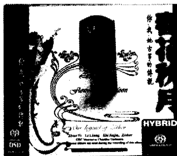
片名：《莲花秋月》 片号：爱必希 SACD-062 出版：2008年 片长：56' 47"

“金石之气”；使用麦草装饰的“天然存真”。还有一种最名贵的“浮光溢彩”，是以铜胎衬底，其间注入蓝釉的景泰蓝装饰古筝，即称为“铜胎掐丝珐琅”古筝。这些民国国宝的亮相，为民间爱好者开列了一场古筝贵胄精品的陈列和演奏展示。专辑的演奏者选出了赵一、李倩、施佳加三位新秀。此款古筝音乐的录制地，选在加拿大广播公司600m 2 的一号录音棚，而由加拿大广播公司温哥华管弦乐队担任伴奏。还有，专辑使用的是直接刻录版SACD形式，是目前国内民乐录音中的高档次演奏。专辑中的12首乐曲，有传统名曲“高山流水”、“彩云追月”、“梁祝”、“战台风”等；有流行金曲“绣金匾”、“夜来香”、“嘎达梅林”、“小城故事”等，甚至名歌改编曲“明天会更好”、“山丹丹开花红艳艳”等也纳入其中。整个演奏品质，绝对上乘，让人进入“丝弦弹落九天韵，一指拨乱半空星”的意境。（朱 横）